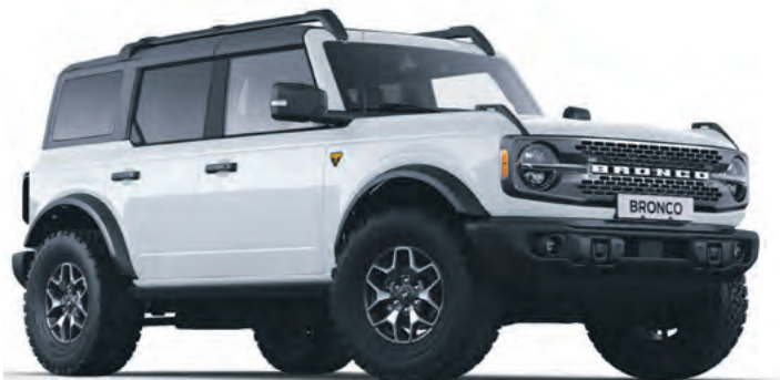
OXFORD WHITE - LAKIER ZWYKŁY bez dopłaty