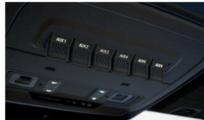
KONSOLA DACHOWA Z PRZEŁĄCZNIKAMI DO PODŁĄCZENIA DODATKOWYCH URZĄDZEŃ

Zderzak tylny - stalowy, malowany proszkowo