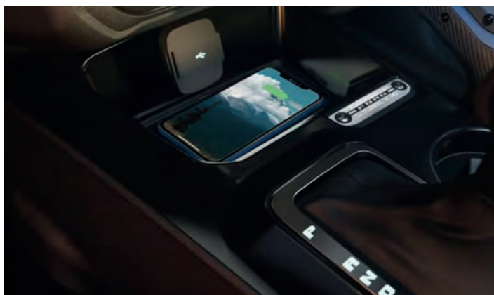
BEZPRZEWODOWA ŁADOWARKA DO SMARTFONÓW Standard