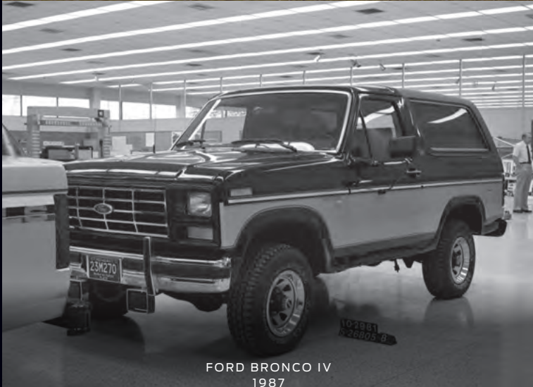
FORD BRONCO IV 1987