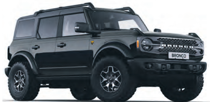
ABSOLUTE BLACK - LAKIER SPECJALNY 5 700,-