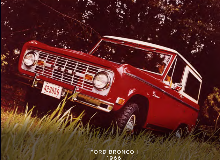
FORD BRONCO I 1966