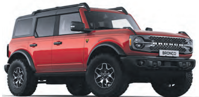
HOT PEPPER RED - LAKIER METALIZOWANY SPECJALNY 6 700,-