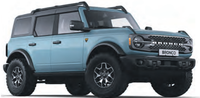
AREA 51 - LAKIER SPECJALNY 6 700,-