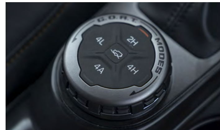
TERRAIN MANAGEMENT SYSTEM™ - SYSTEM WYBORU TRYBU JAZDY Standard