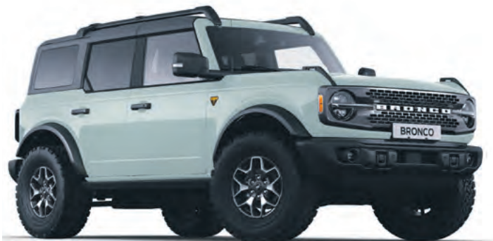
CACTUS GREY - LAKIER SPECJALNY 6 700,-