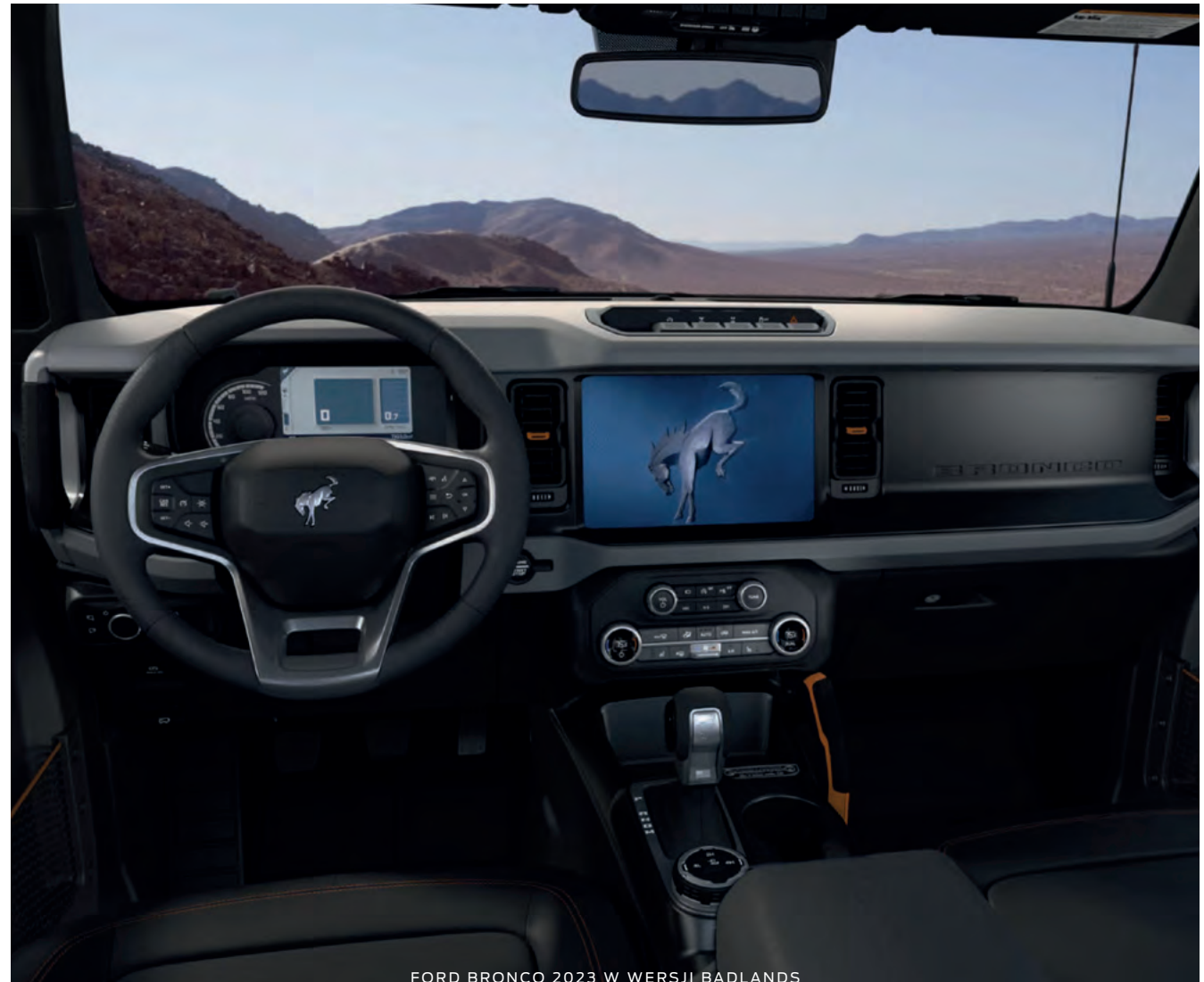
FORD BRONCO 2023 W WERSJI BADLANDS