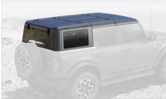
DACH HARDTOP W KOLORZE CARBONIZED GREY Standard