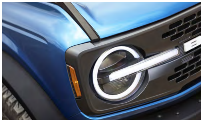
REFLEKTORY W TECHNOLOGII LED Standard