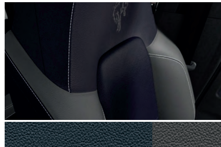
TAPICERKA SKÓRZANA W TONACJI DARK SPACE GREY Standard dla wersji OUTER BANKS

NOWY FORD BRONCO OUTER BANKS Z LAKIEREM ZWYKŁYM FROZEN WHITE (OPCJA) (ilustracje mogą nieznacznie różnić się od wersji produkcyjnej)