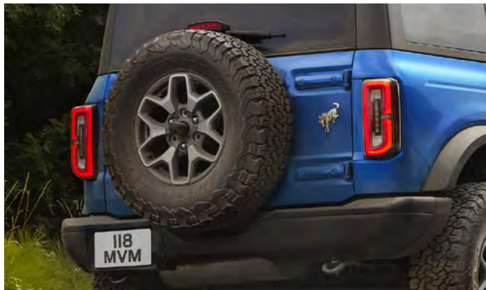
KOŁO ZAPASOWE NA TYLNEJ KLAPIE Standard