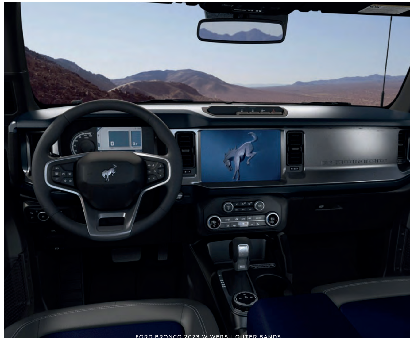
FORD BRONCO 2023 W WERSJI OUTER BANKS