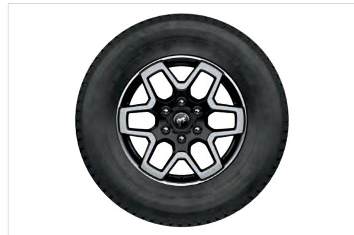
18" OBRĘCZE KÓŁ ZE STOPÓW LEKKICH, OGUMIENIE A/T 255/70 Standard dla wersji OUTER BANKS