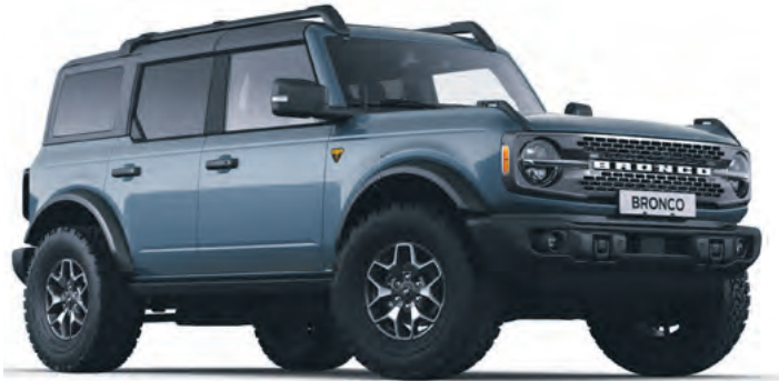
AZURE GREY - LAKIER METALIZOWANY SPECJALNY 6 700,-