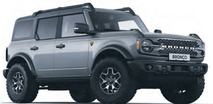
CARBONIZED GREY - LAKIER METALIZOWANY 5 700,-