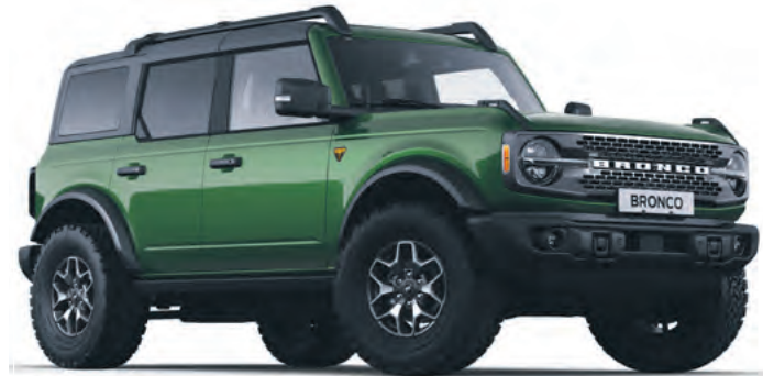
ERUPTION GREEN - LAKIER METALIZOWANY 5 700,-