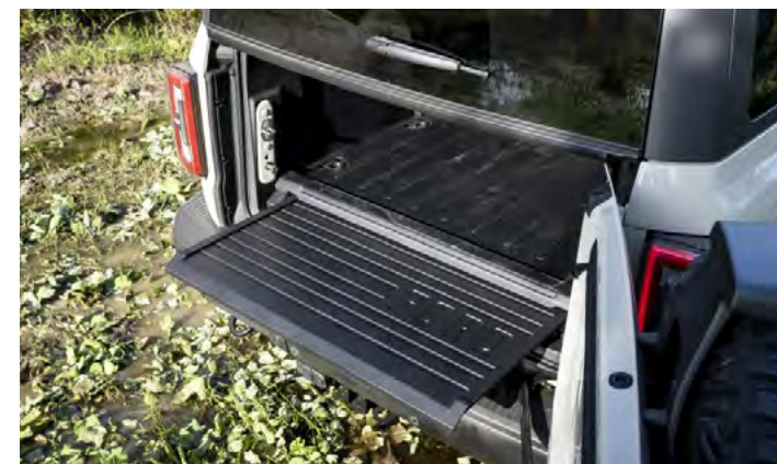
WYSUWANY STOPIEŃ POD PODŁOGĄ DRZWI BAGAŻNIKA