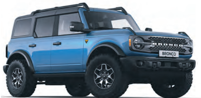
VELOCITY BLUE - LAKIER METALIZOWANY 6 700,-