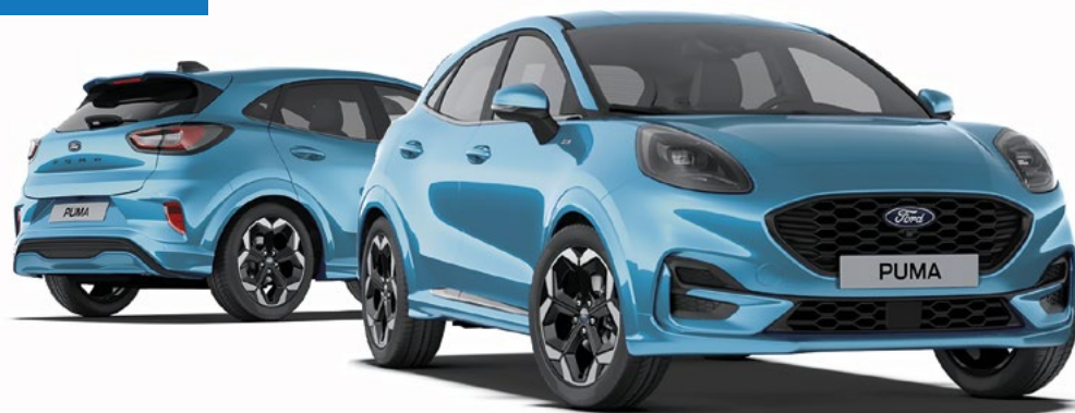
Nowy Ford Puma w wersji ST-LINE X z lakierem metalizowanym Digital Aqua Blue (opcja)

netto mies. dla firm z Ford Leasing Opcje 1