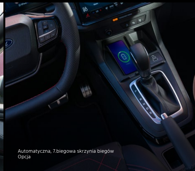
Automatyczna, 7-biegowa skrzynia biegów Opcja

Nowy Ford Puma w wersji ST-Line X z opcjonalnym wyposażeniem