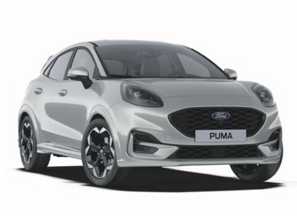
SOLAR SILVER - LAKIER METALIZOWANY 2 500 zł