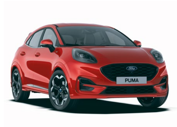
FANTASTIC RED - LAKIER METALIZOWANY SPECJALNY 3 800 zł