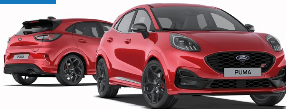
Nowy Ford Puma w wersji ST z lakierem metalizowanym specjalnym Fantastic Red (opcja)

netto mies. dla firm z Ford Leasing Opcje 1