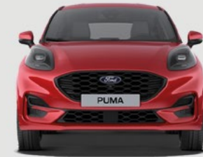
ST-LINE, ST-LINE X: 1930 mm