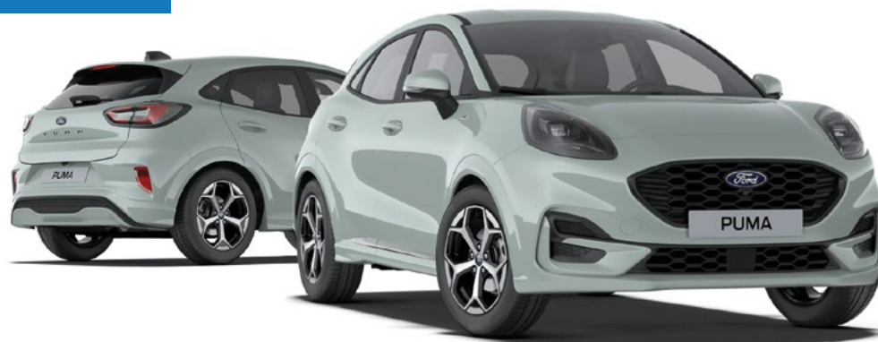
Nowy Ford Puma w wersji ST-LINE z lakierem zwykłym Cactus Grey (opcja)

netto mies. dla firm z Ford Leasing Opcje 1