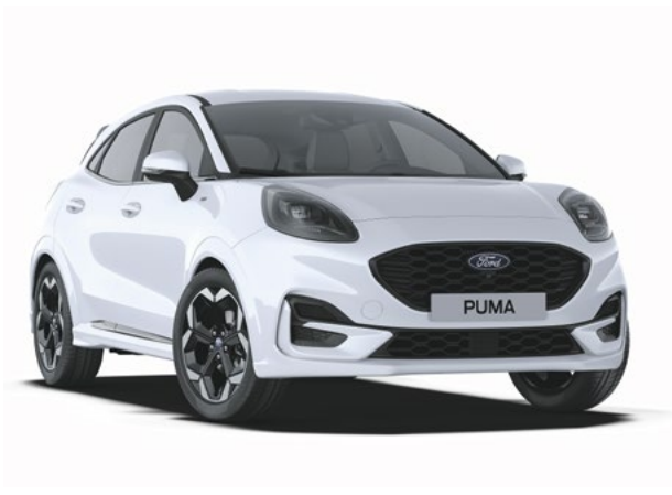
FROZEN WHITE - LAKIER ZWYKŁY bez dopłaty