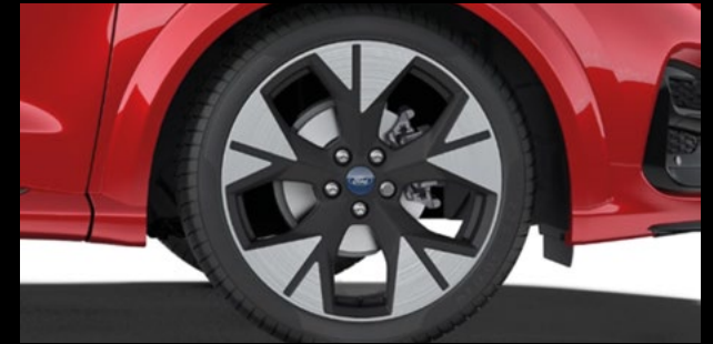
19-CALOWE OBREŹCZE KÓŁ ZE STOPÓW LEKKICH OGUMIENIE 225/40