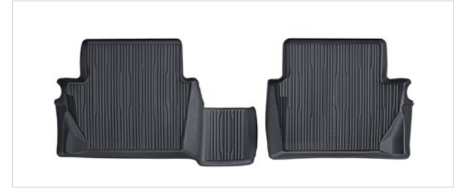
DYWANIKI PODŁOGOWE, GUMOWE CZARNE - NA TYŁ (2 109 989) 178 zł