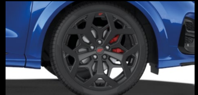
19-CALOWE OBREŹCZE KÓŁ ZE STOPÓW LEKKICH Z LOGO ST OGUMIENIE 225/40