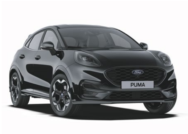
AGATE BLACK - LAKIER METALIZOWANY 2 500 zł