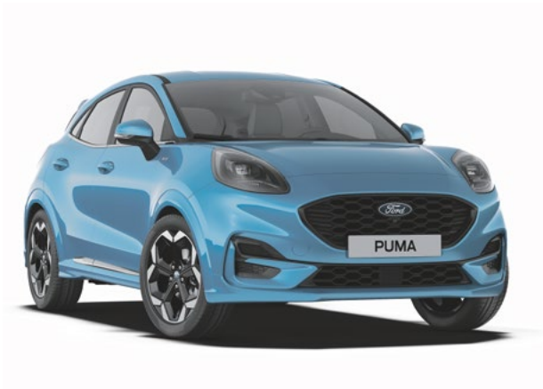
DIGITAL AQUA BLUE - LAKIER METALIZOWANY 3 800 zł