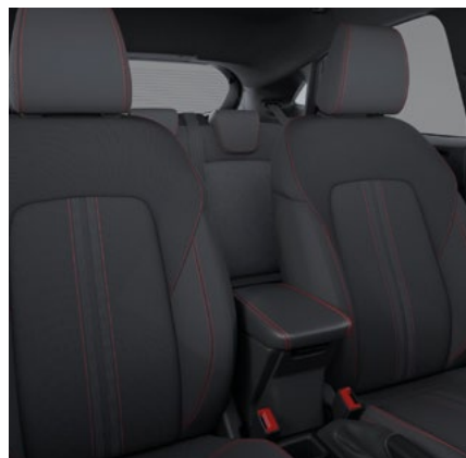
Nowy Ford Puma w wersji ST-LINE ze skrzynią manualną i tapicerką materiałową z czerwonymi akcentami (standard)