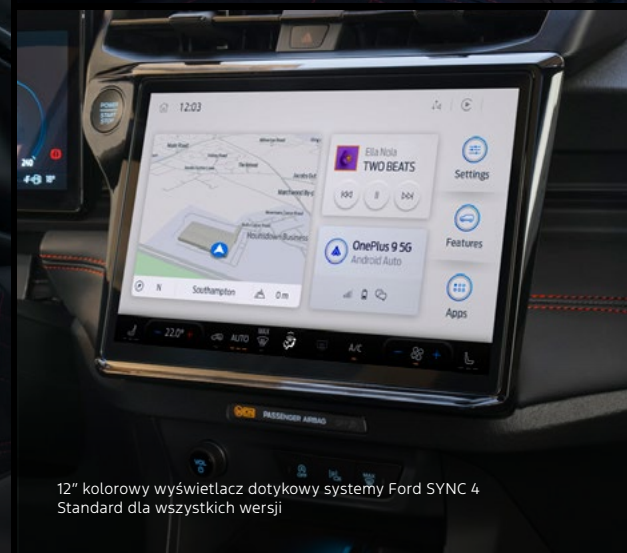
12" kolorowy wyświetlacz dotykowy systemu Ford SYNC 4 Standard dla wszystkich wersji