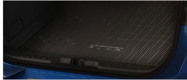
MATA ANTYPOŚLIZGOWA DO BAGAŻNIKA - Z LOGO PUMA (2 438 719) 325 zł