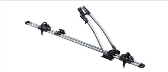
THULE®* UCHWYT DO PRZEWOZU ROWERU FREERIDE 532 (1 746 077) 470 zł - wymaga zamówienia bagażnika dachowego