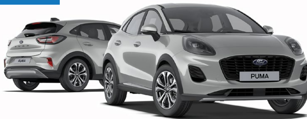
Nowy Ford Puma w wersji Titanium z lakierem metalizowanym Solar Silver (opcja)

netto mies. dla firm z Ford Leasing Opcje 1