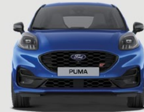
ST: 1930 mm