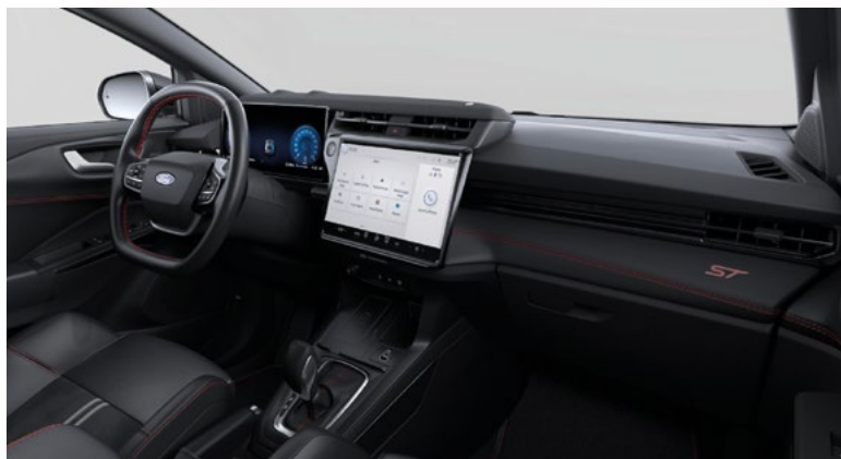
Nowy Ford Puma w wersji ST z fotelami sportowymi Ford Performance z tapicerką częściowo skórzaną (standard)