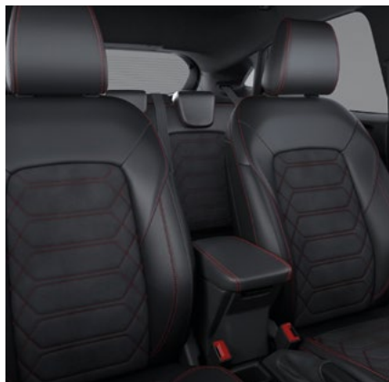
Nowy Ford Puma w wersji ST-LINE X ze skrzynią automatyczną i tapicerką częściowo skórzaną z akcentami w w kolorze czerwonym (standard)