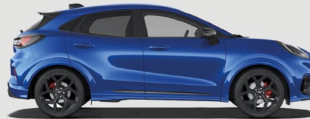
ST: 4226 mm