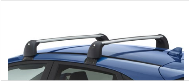
BAGAŻNIK DACHOWY ( 2 527 164) 1 488 zł