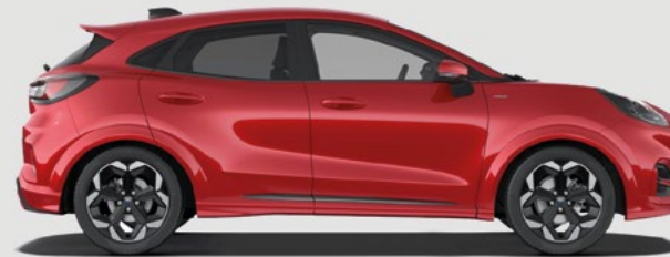
ST-LINE, ST-LINE X: 4207 mm