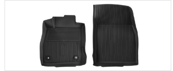
DYWANIKI PODŁOGOWE, GUMOWE CZARNE - NA PRZÓD (2 439 078) 273 zł