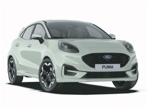
CACTUS GREY - LAKIER ZWYKŁY 1 500 zł