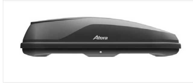
ATERA* BOX DACHOWY CASAR M ( 2 756 524) 2 435 zł - wymaga zamówienia bagażnika dachowego