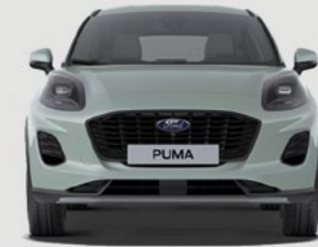
Titanium: 1930 mm