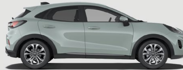
Titanium: 4186 mm