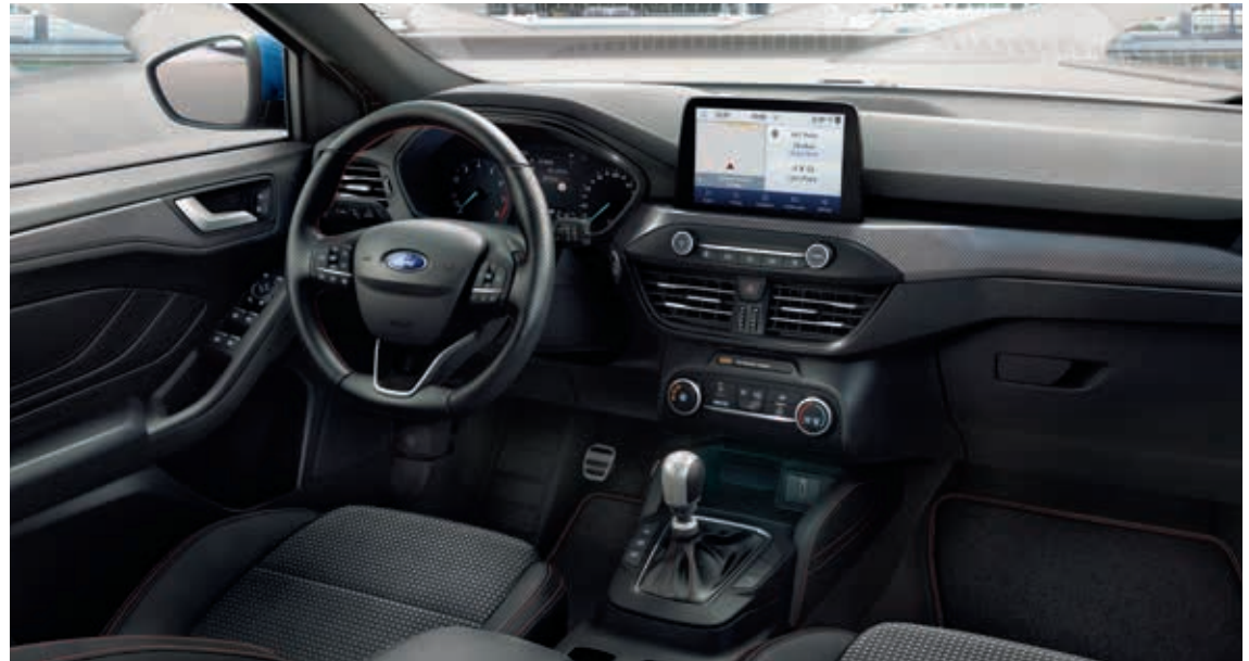
Ford Focus ST-Line