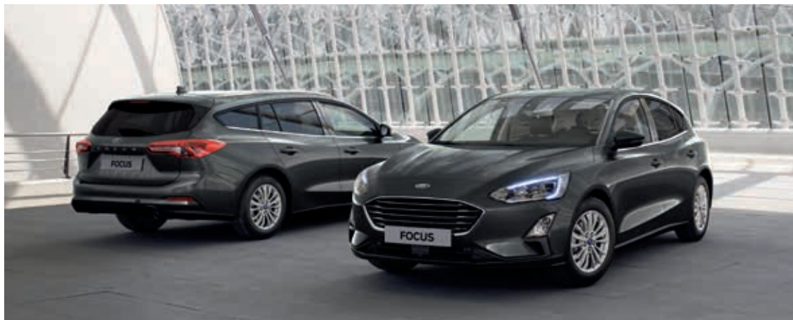
Ford Focus Titanium w kolorze Magnetic Grey (opcja)