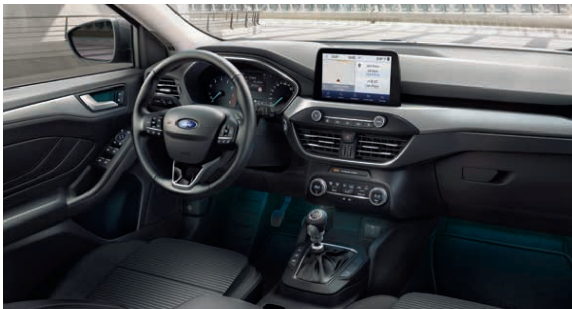
Ford Focus Titanium

EcoBoost - silnik benzynowy, turbodoładowany, EcoBlue - silnik wysokoprężny, turbodoładowany, M6 - 6-biegowa, manualna skrzynia biegów, A8 - 8-biegowa, automatyczna, hydrokinetyczna skrzynia biegów. Wszystkie silniki wyposażone są w Auto-Start-Stop. Wszystkie silniki wysokoprężne wyposażone są w filtr cząstek stałych DPF, wszystkie silniki benzynowe wyposażone są w filtr cząstek stałych GPF. Silnik 1.5 EcoBlue nie wymaga stosowania płynu AdBlue. Silnik 2.0 EcoBlue wyposażony jest w system SCR i wymaga stosowania płynu AdBlue. Wszystkie silniki spełniają normę emisji spalin Euro 6.2.