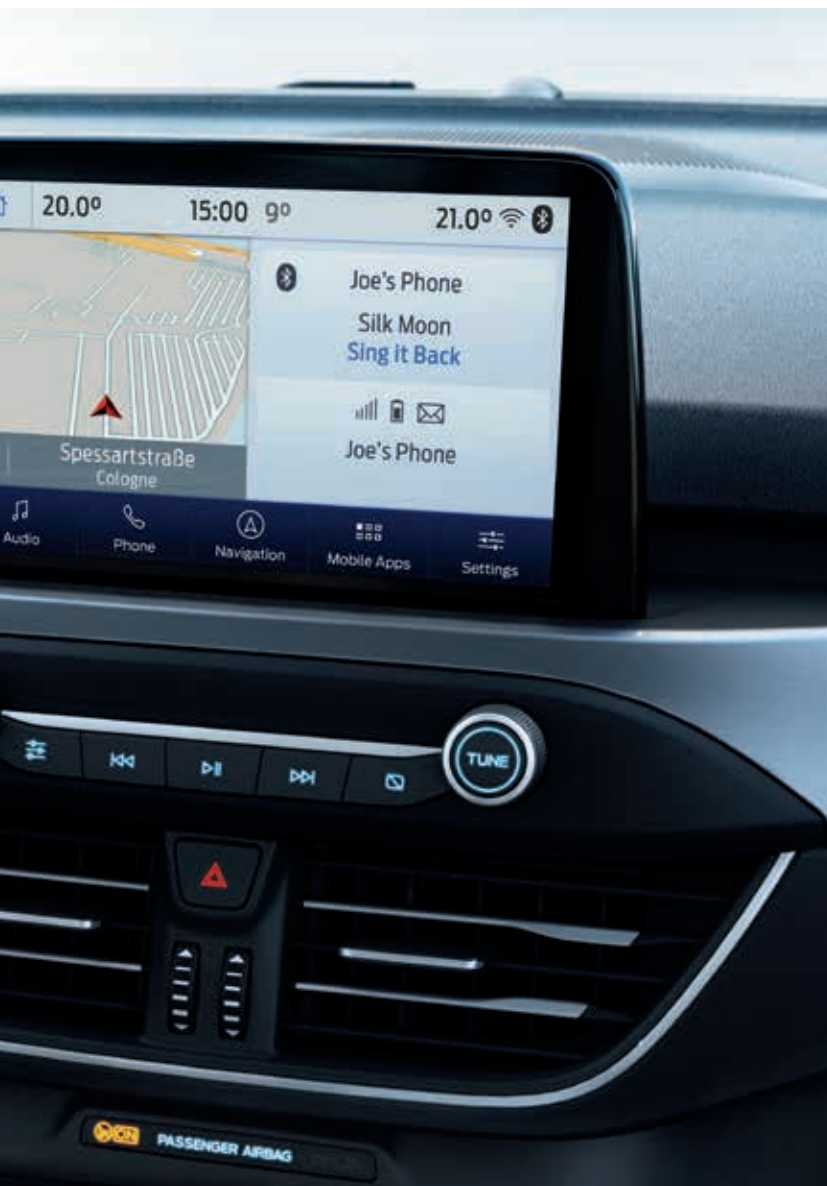
Ford Focus Titanium z systemem nawigacji satelitarnej