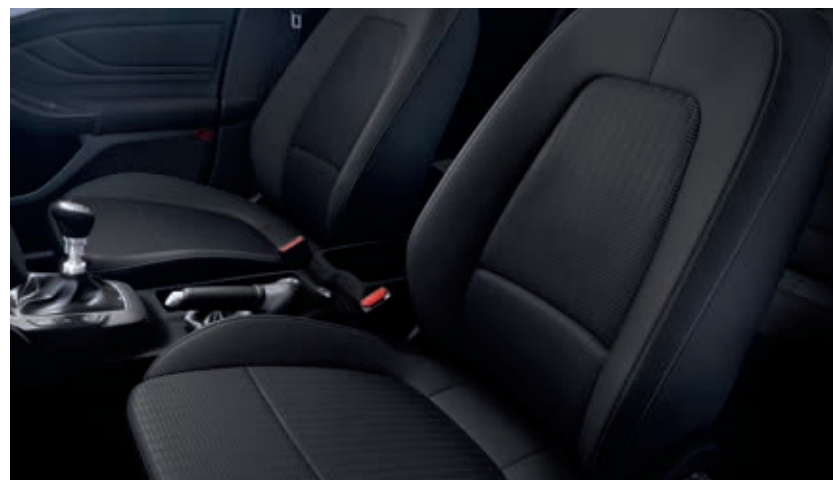
Tapicerka materiałowa Moonwalk