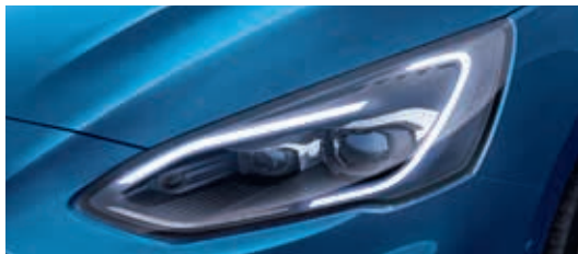
Adaptacyjne reflektory Full LED ze światłami drogowymi zapobiegającymi oślepieniu i sekwencyjnymi kierunkowskazami LED

TREND EDITION | TITANIUM | ST-LINE Pakiety: Design 1, Design 2