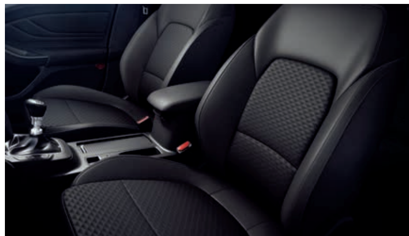
Tapicerka częściowo skórzana Zaha/Salerno zawiera podgrzewane przednie fotele