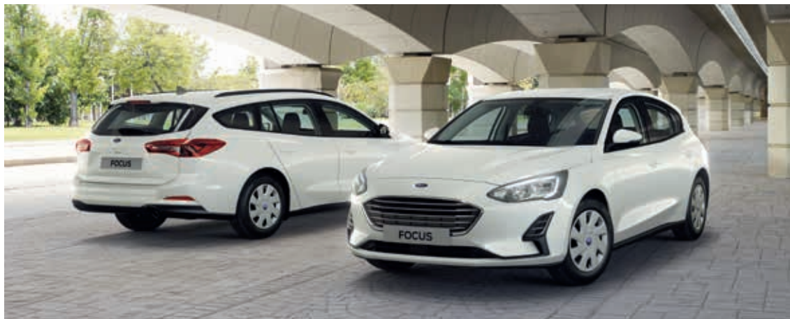
Ford Focus Trend w kolorze Frozen White (opcja)