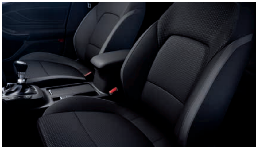
Tapicerka materiałowa Foundry / Eton