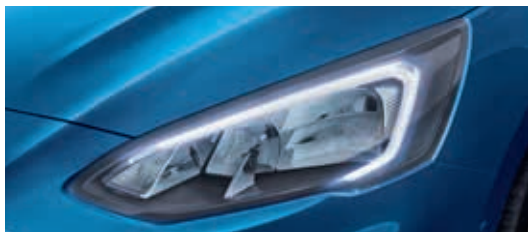
Reflektory LED ze światłami do jazdy dziennej LED oraz światłami drogowymi halogenowymi

TREND | TREND EDITION | TITANIUM | ST-LINE Standard