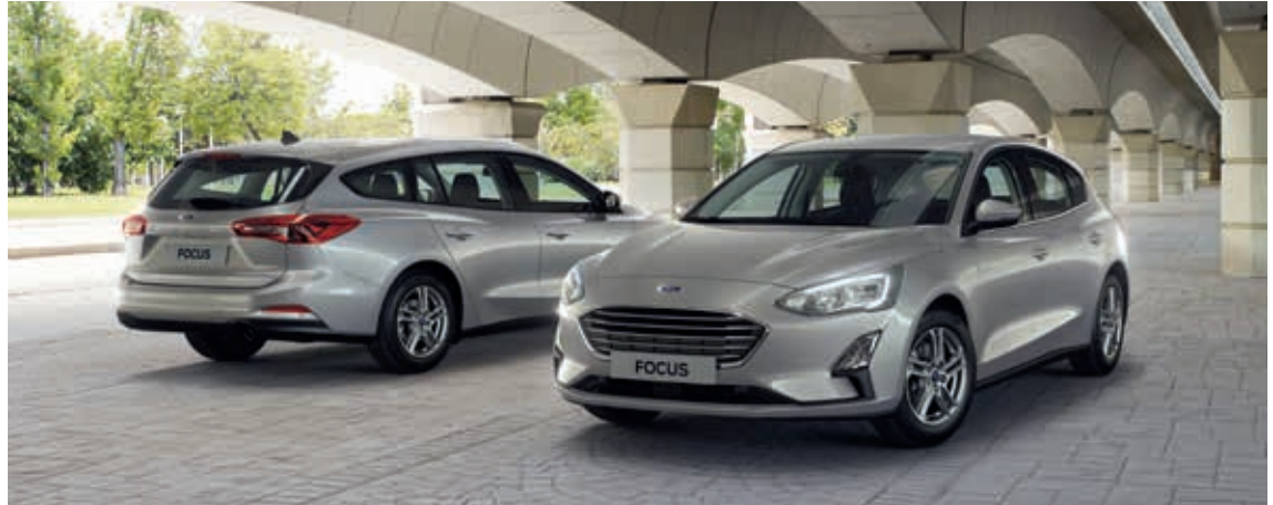
Ford Focus Trend Edition w kolorze Moondust Silver (opcja)