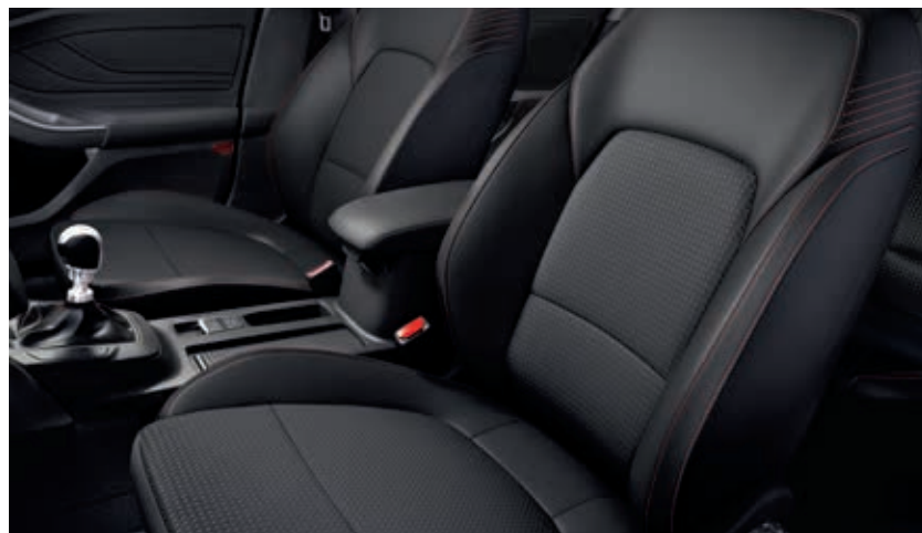
Tapicerka częściowo skórzana Foundry / Salerno z czerwonymi akcentami zawiera podgrzewane przednie fotele