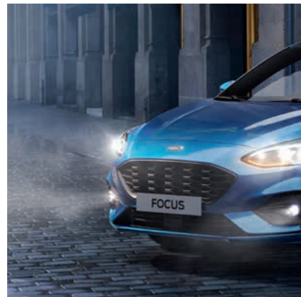
Ford Focus ST-Line w kolorze Desert Island Blue i 18" obręczami (opcja)