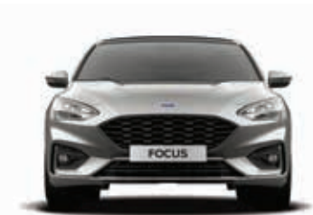
Szerokość całkowita z lusterkami / bez lusterek bocznych / ze złożonymi lusterkami 1979 / 1825 / 1848 mm

Pomiar zgodnie z normą ISO 3832. Rzeczywiste wymiary mogą się różnić od podanych wartości w zależności od wersji wyposażenia.