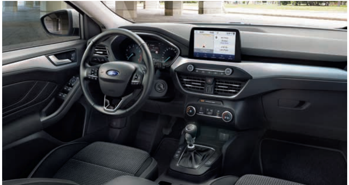
Ford Focus Trend Edition