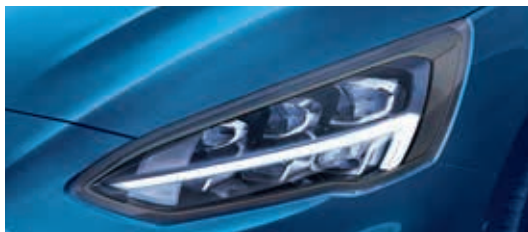
Stacyjne reflektory Full LED

TREND | TREND EDITION | TITANIUM | ST-LINE Standard