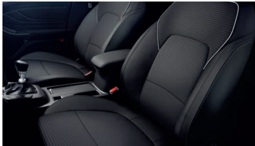
Tapicerka materiałowa Ray / Niro