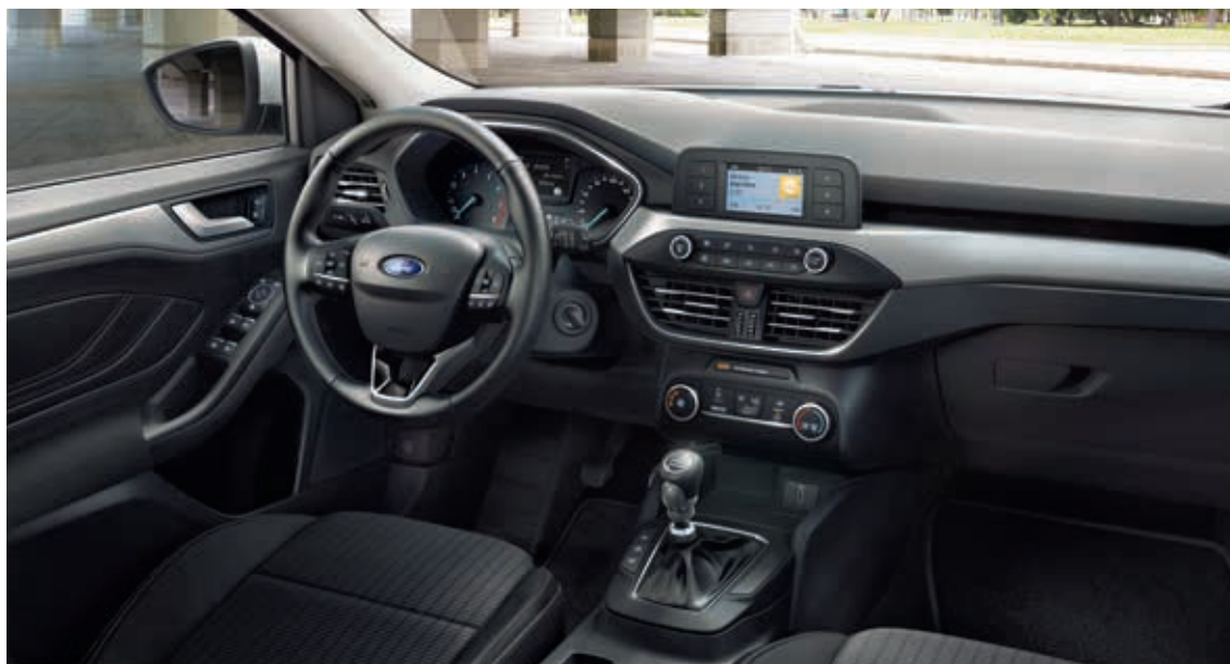
Ford Focus Trend