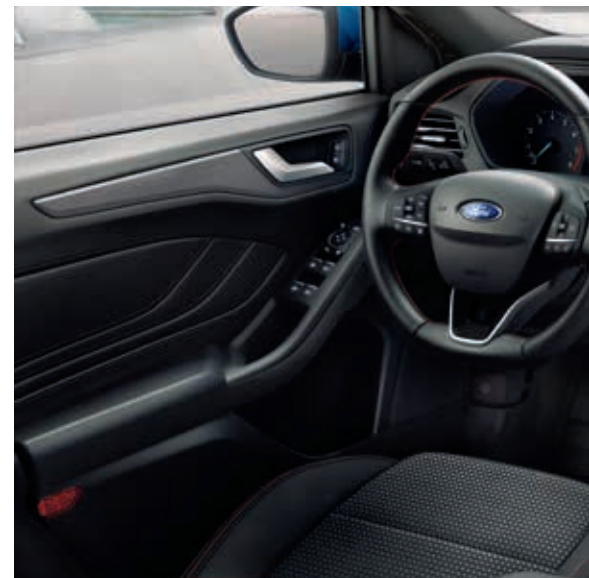
Ford Focus w wersji ST-Line