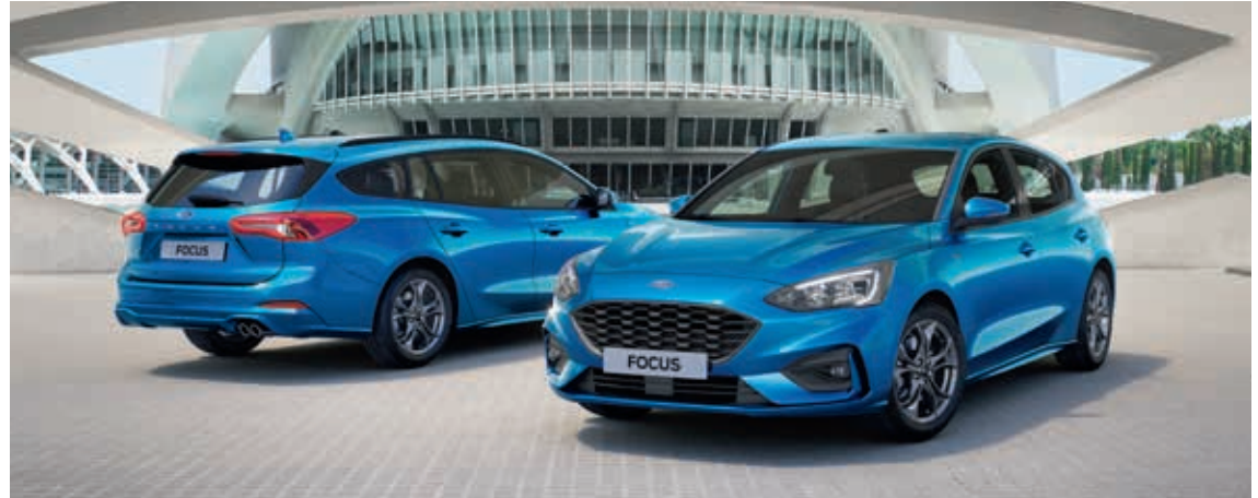
Ford Focus ST-Line w kolorze Desert Island Blue (opcja)