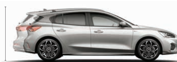
Długość całkowita (5-drzwiowa / kombi): 4378/4668 mm

Wysokość całkowita bez relingów bagażnika (5-drzwiowa / kombi): 1452 / 1469 mm